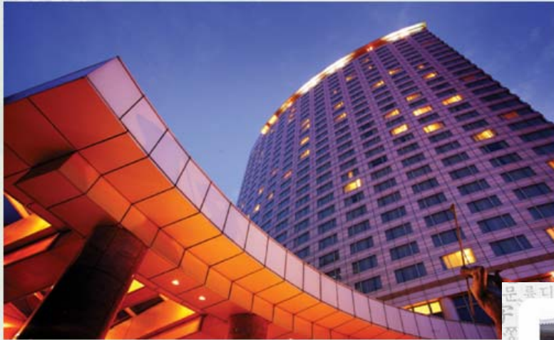
Coex Convention Centre, Seoul